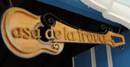
Casa de la Trova'da dans gecesi