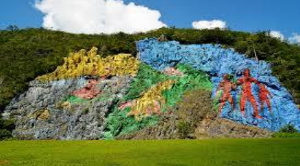
Vadide yer alan kaya resmi