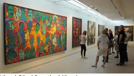
Ulusal Güzel Sanatlar Müzesi