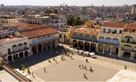
Ünlü bira evi ve kahve dükkanıyla Plaza Vieja