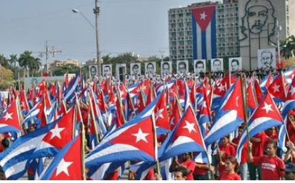
Devrim Meydanı'nda 1 Mayıs kutlamaları