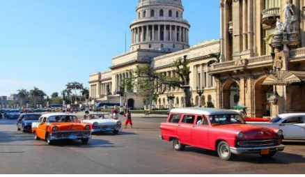
Küba'ya hoş geldiniz