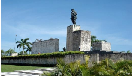
Che Guevara'nın Santa Clara'daki anıt mezarı