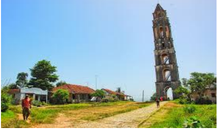
Şeker Vadisi'ne yolculuk