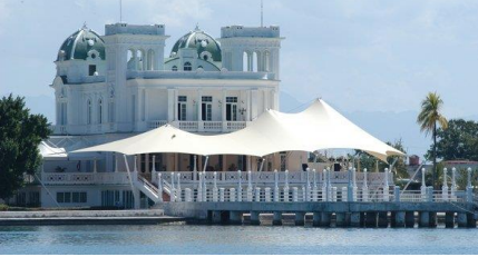
Cienfuegos Yat Kulübü