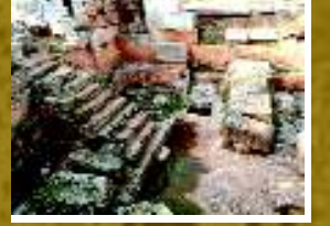
Hamam İçi Görünüm