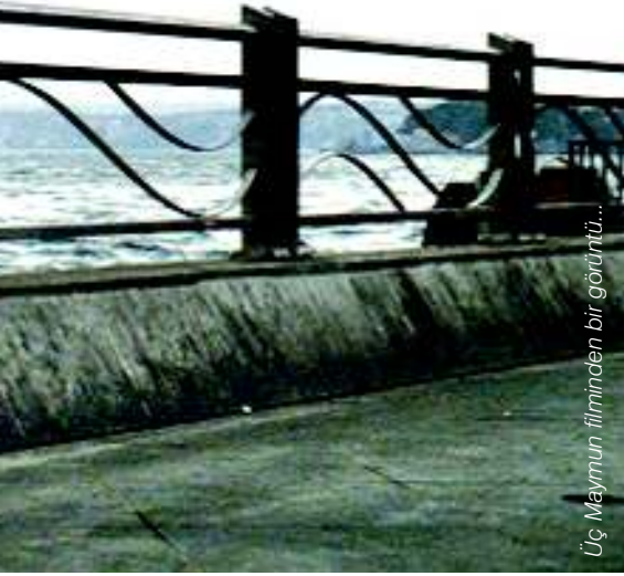
Üç Maymun filminden bir görüntü...

bir Yeşim Ustaoğlu filmi, "Pandoranın Kutusu" ise geçtiğimiz günlerde, San Sebastian Film Festivali'nde "En İyi Film" ödülünü alarak bizi sevindirdi.