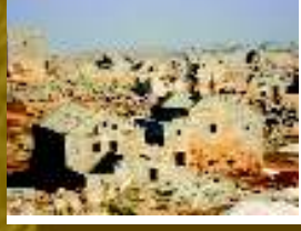
Sergilla genel görünüm

■ 9 Şubat 2008 öğle sonrası. Gezimizin sonuna yaklaşıyoruz, burası "dead cities - ölü kentler" olarak anılan bölge içinde yer alan bir Bizans yerleşimi. Bara Kasabası'nın hemen çıkışının doğusuna 4 km. gidildikten sonra Bauda adlı kasabaya varılıyor ve onun çıkışından da yaklaşık 3 km sonra ise, Sergilla'ya varıyoruz. Ertan Beyin açıklamalarına göre, bölge çok iyi bilinmiyor ve arkeolojik olarak fazla da araştırılmamış. Ölü kentler bölgesinde Sergilla benzeri yaklaşık 100 kadar Bizans yerleşim yeri var. Bölge, doğuya doğru 140 km ve Türkiye sınırından itibaren de güneye doğru 100 km.'lik bir alan içine yayılmış bulunmakta.