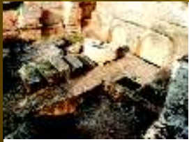
Villa İçi Görünüm

Aşağıya doğru, ise, bir Hamam, bir Toplantı Evi (andron) ve bir Kilise olduğunu sonradan öğrendiğimiz yapılar var. Hamam'ın İ.S. 473 yıllarında yapıldığı saptanmış. Böyle bir yerde bir hamam yapısının var olması, burada yaşayan topluluğun refah seviyesine işaret ediyormuş. Muhtelif yapıların altında yer alan birçok sarnıç ve kuyuların varlığı, bizleri şaşırtıyor.