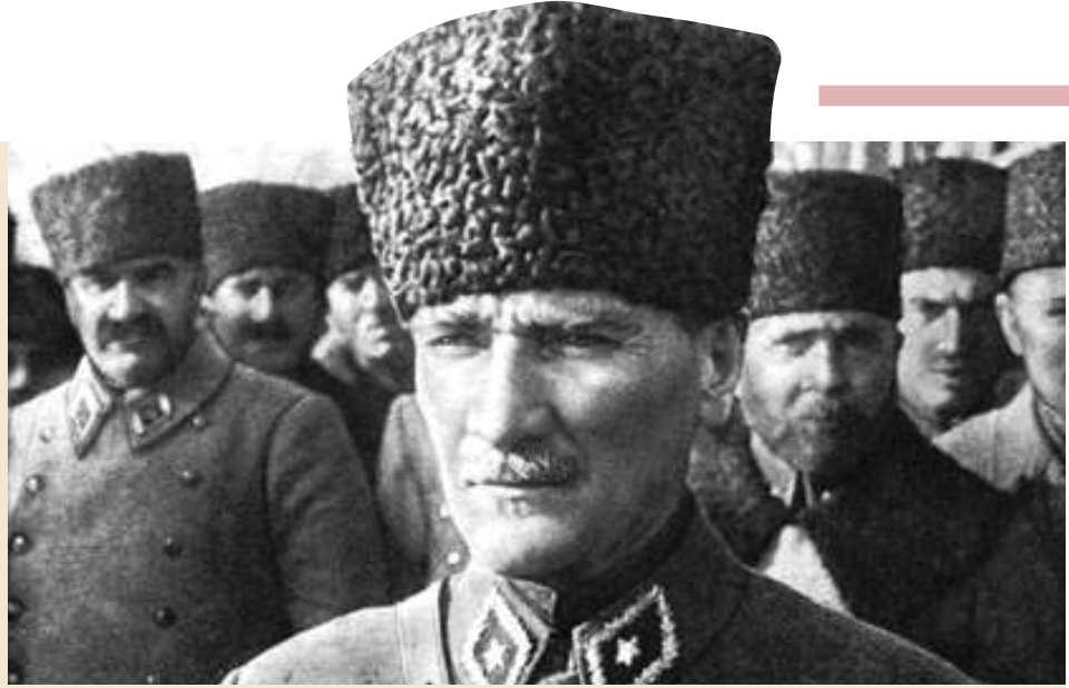
Mustafa Kemal yoldaşı Attilâ İlhan anlatır halimizi Mustafa Kemal'e;